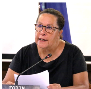
声明を読み上げる太平洋諸島フォーラム(PIF)のテイラー事務局長

「太平洋諸島フォーラム」事務局長は、4月13日、「日本政府が、福島第一原発からALPS処理水を太平洋に放出すると決定したことに対し、私たちの深い憂慮を表明」との声明を発表しました。声明では、太平洋地域での度重なる核実験による放射能汚染と、1980年代の日本による同地域への低レベル廃棄物の投棄への反対を背景に締結された「南太平洋非核地帯条約」(ラロトンガ条約)は、「この地域が放射性廃棄物及びその他の放射能問題による環境汚染から免れるように保持することを定めている。」