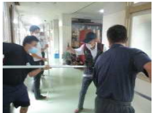
【刺股で不審者確保】

当日は、学校の玄関から不審者が進入し、事務主任が職員室へ連絡後、職員が駆けつけるという想定で行いました。不審者確保後、全校放送で講堂に避難するよう指示をして、全校生徒及び教職員全員が8分で集合完了しました。生徒は無言迅速に真剣な態度で取り組むことができ、講師の少年安全サポーターからお褒めの言葉をいただきました。