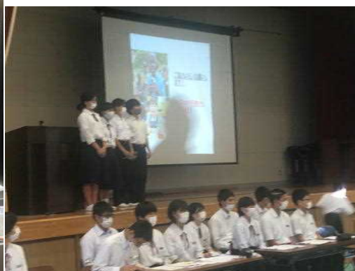
【抜群のプレゼンテーション】