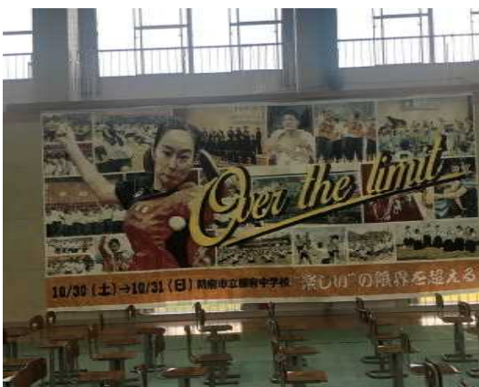
【全校生徒制作の モザイクアート】