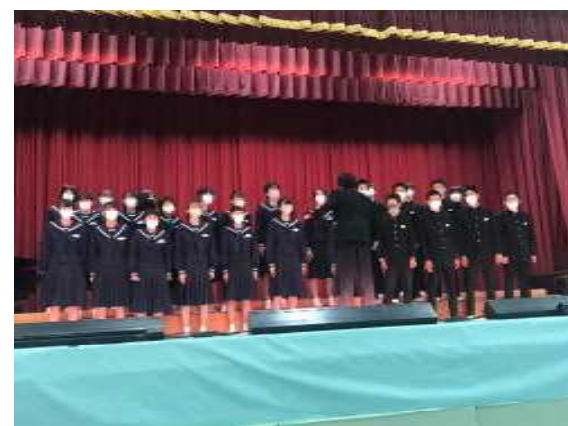
【見事合唱コンクールグラン プリに輝いた3年1組】