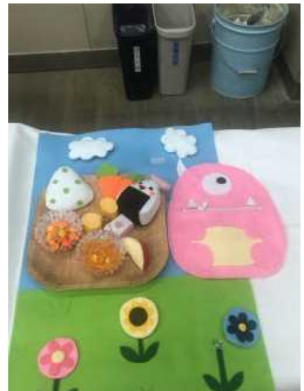
【家庭科部作品展示】