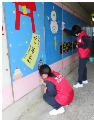
壁画清掃(上・右上)

今年度、本校芸術部は、この清掃活動の他にも、牟礼公民館での作品の展示や市役所の新庁舎建設のFENCE ART PROJECTにも参加し、素晴らしい作品を披露しました。芸術部の心温まる作品を、ぜひご覧ください。