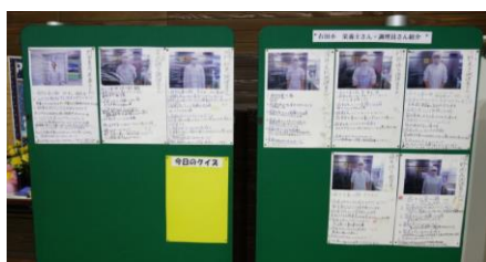
【委員会作成の紹介パネル】

8万7千食を、給食室の調理員の皆さんと、栄養士がタッグを組んで作っています。献立は、栄養素の多い旬の食材を使い、季節や行事に合わせた多彩な献立を立てています。1月25日～29日は給食週間でした。ベトナム、韓国、イギリス、タイ、インドの料理の献立でした。給食委員会の児童が、日頃会うことがなかなかできない調理員の皆さんの紹介を作ってくれました。毎日献立の紹介と、クイズが出されました。一人ひとりが、食について考える一週間となりました。