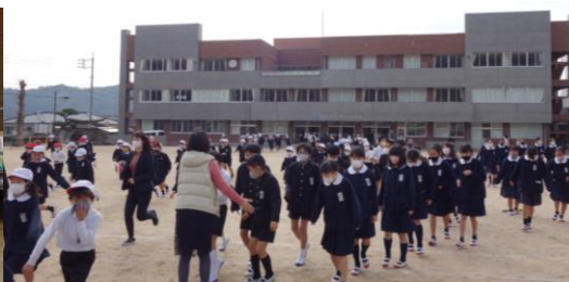
運動場では小走りで