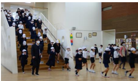
火元から離れて避難

1月25日～29日は、「日時を告げない避難訓練」の週でした。木曜日の9時30分、訓練警報が鳴り、第一発見者から緊急放送が流れました。この訓練の目的は、手際よく短時間で避難することではなく、「実際の災害時により近い状態」を体験し、「改善するところを見つける」ことにあります。担任から、綿密な事前指導が行われ、子どもたちには避難時には「どこに」「どうやって」「だれを目印に」集まるのかを知らせました。右田小の子どもたちは、それぞれの活動場所から、精一杯の力で避難しようとし、真剣な態度で訓練に臨みました。立派でした。今回の訓練(火災)で学んだ「よく聴く」「教員の指示に従う」「お・は・し・も、の約束を守る」を心に留め、実際の避難時に生かしてほしいと願っています。