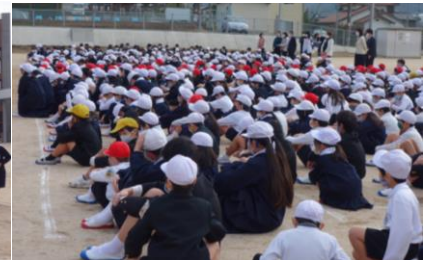
真剣に話を聴いています