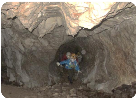
頭をぶつけないよう気を付けて！