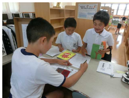
朝の図書室の様子