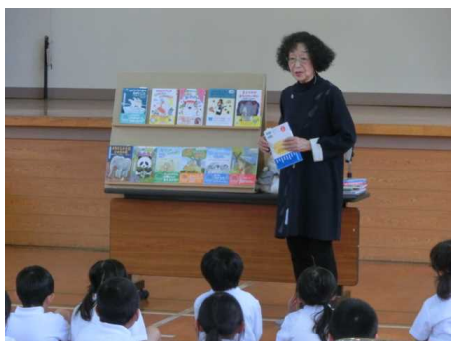
新しい本と出会う会の様子

厚保小学校では今、金曜日の朝学の時間を読書の時間に設定し、読み聞かせや全校読書に取り組んでいます。読み聞かせの際には、図書ボランティア（読みまくり隊）の方が来校され、様々な本との出会いを演出して下さいます。また、全員の児童が「読書通帳」をもち、一人ひとりが目標を決めて意欲的に読書に取り組んでいます。たくさん子どもたちが、校長室にやってきて、嬉しそうに読書貯金通帳を見せてくれます。「この本、おもしろかったよ。」「どんなお話だったの?」「〇〇と〇〇が出てきてね…。本っておもしろいね。」会話が弾みます。笑顔で語ってくれる表情を見ていると私まで嬉しくなります。読書を通して、心豊かな子どもが育っていくことを心から願っています。