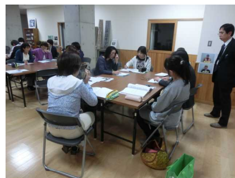
3つの部会に分かれての協議の様子

本校がコミュニティ・スクールに指定されて6年目になりました。4月22日の運営協議会では「心づくり部」「体づくり部」「学びづくり部」の3つの部会に分かれ、今年度も学校と地域が手を携え、子どもたちのよりよき成長を目指して取り組みを進めていくことを共通理解しました。委員の皆様には、お忙しい中、夜遅くまで熱心に議論していただきました。本当にありがとうございました。