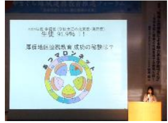
あつマロネットの紹介