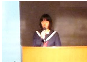
生徒会長からの説明