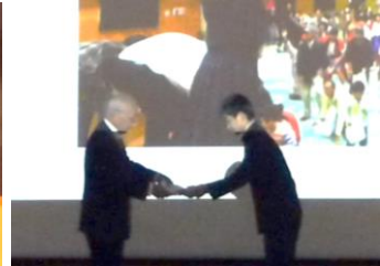
生徒から感謝状のサプライズ