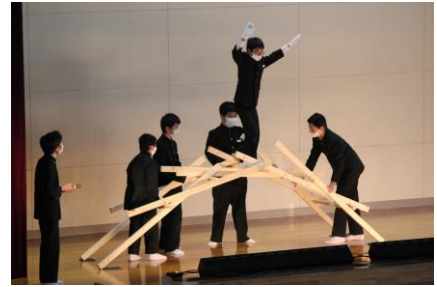
科学部による発表

午後のステージは、吹奏楽部の演奏から始まりました。迫力のある見事な演奏を披露し、会場を盛り上げました。科学部は、研究成果の発表や実験を披露し、日頃の部活動の成果を発揮することができました。