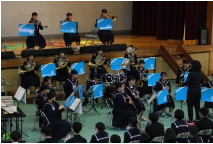
吹奏楽部による演奏