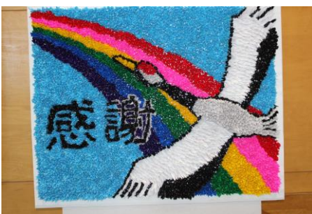
1年生「医療従事者に向けて」