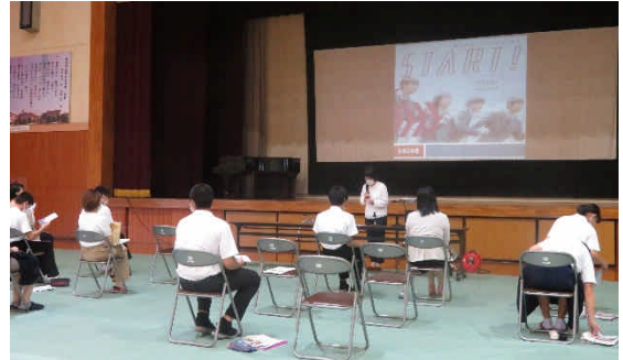
1学期3年生進路説明会の様子

子どもたちには、自分のめざす「目的」、それを達成するための「目標」をしっかりもって、前に進み続けてほしいと願っています。