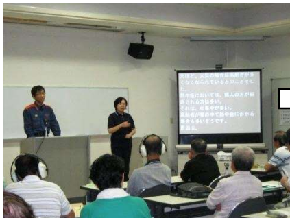
消防署員による講義

8月30日(金)に消防署や山口県障害者支援課のご協力の元、聴覚障害者、法人理事・評議員、地元派出所、地元自治会、山口南総合支援学校等の関係者など延べ30人が一堂に集まり、職員と合同での避難訓練や交流を行いました。雨の中でしたが、午前中は、消防署員による「消防・防災における基礎知識」の講義をいただいた後、実際に通報訓練や煙体験による避難訓練、水消火器を使っての消火訓練を全員で行いました。また、消防署員による救助の様子を見学しました。午後は、避難場所での過ごし方等を話し合ったり、ゲームで交流を深めました。