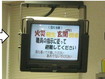
インフォメーション