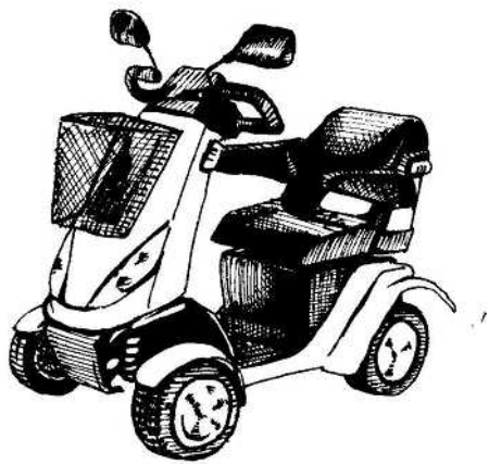
モンパルML200 (ホンダ) 全長 1,190×全幅 595×全高 1,045mm 重量 (バッテリー含む) 115kg