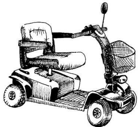
セレブレティ (プライド) 全長 1,190×全幅 610 重量 (バッテリー含む) 74.1kg