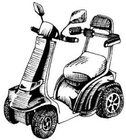
ポルカー ウィンディア (福伸電機) 全長 1,190×全幅 635×全高 1,070mm 重量 (バッテリー含む) 100kg