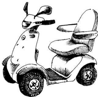
ラクロード (クボタ) 全長 1,190×全幅 650×全高 1,035mm 重量 (バッテリー含む) 105kg