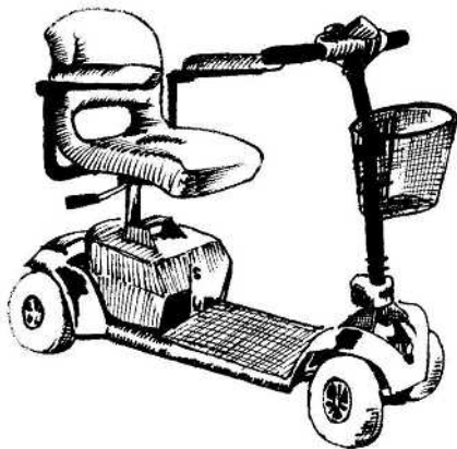
ゴゴ (プライド) 全長 1,010×全幅 580 重量 (バッテリー含む) 50kg