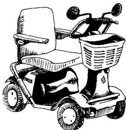
タウンカート(スズキ)