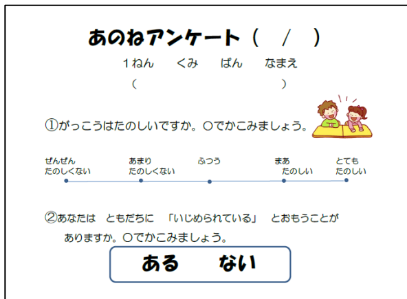
学校生活アンケート（1年用）