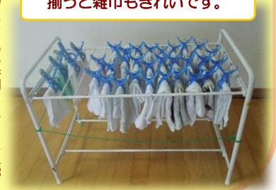
揃うと雑巾もきれいです。

今年度も、6年生が「あいさつ運動」を引き続き実施しています。また、「朝読書」「スキルタイム」「かかと揃え」等も継続しています。次第に、右田小学校の普通の様子となりつつあります。当たり前のように続けることが、本当の力が子どもたちに身に付く秘訣だと思います。