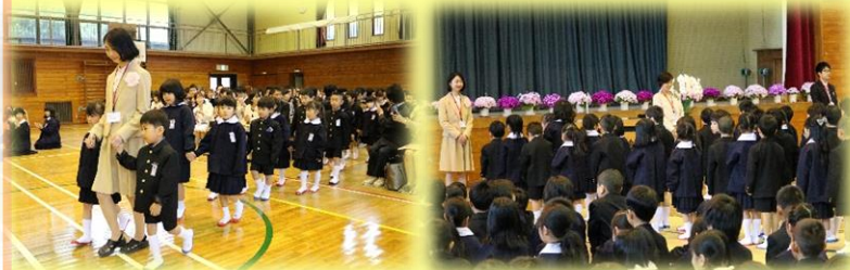
立派な姿勢と態度でした。

4月11日に82名の1年生を迎え入れ入学式を行いました。1年生は担任の先生と手をつないで入場し、来賓の方々の見守る中、立派な態度で頑張りました。