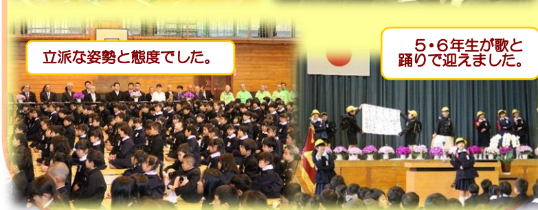
5・6年生が歌と踊りで迎えました。