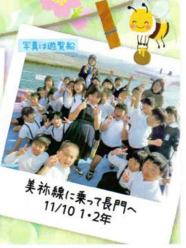
美祢線に乗って長門へ 11/10 1・2年