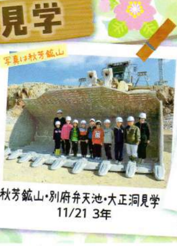
秋芳鉦山・別府弁天池・大正洞見学 11/21 3年