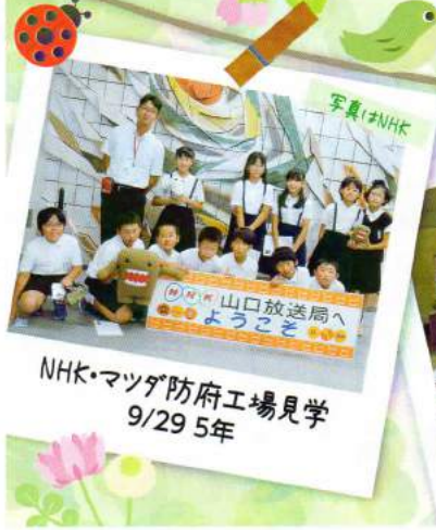
NHK・マツダ防府工場見学 9/29 5年