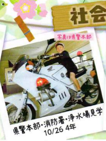
県警本部・消防署・浄水場見学 10/26 4年