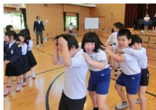
【恒例！ジャンケン列車】