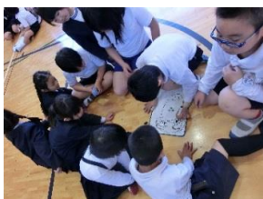
【縦割り班で校長先生の似顔絵作成】

「 一年生を迎える会 」企画委員会を中心に計画・準備を進めた集会在、大成功に終わりました。楽しいゲームに、上級生からのプレゼント... 笑顔あふれる集会となりました