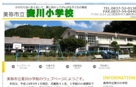
【麦川小ホームページの充実】