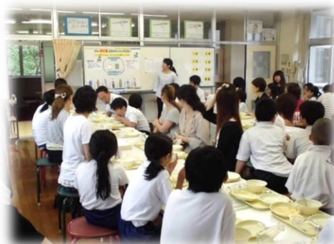
【給食試食会にて糖分の摂取に係る話】