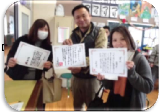
【2分の1成人式で感謝状を受け取った保護者】