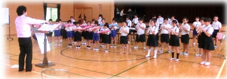
【大嶺中教員による合奏指導】