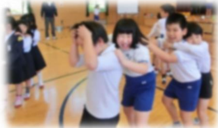
【児童主体の集会活動】