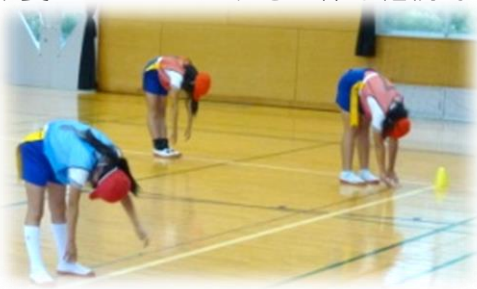
【柔軟性の向上をめざした健康タイムの取組】