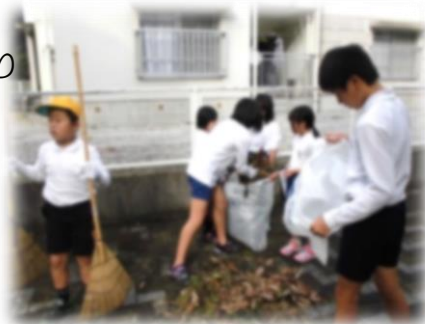
【麦川ありがとう作戦（清掃活動）】