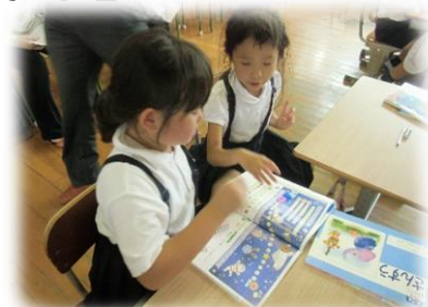
【1年算数の研究授業より】