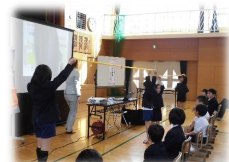
【生活習慣に関わる学校保健安全委員会】