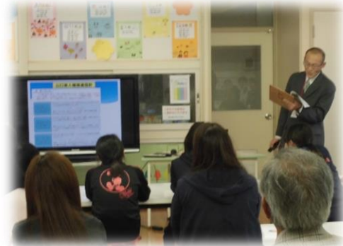
【人権教育参観日（ビデオフォーラム）】