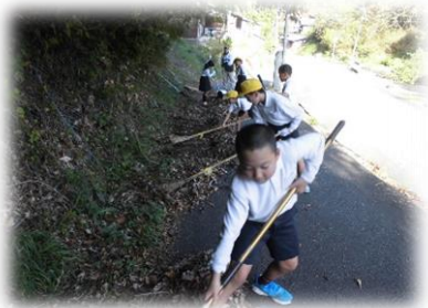
【麦川ありがとう作戦（清掃活動）】