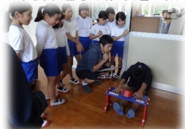
【柔軟性の向上をめざした健康タイムの取組】