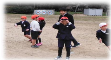
【子どもたちとおにごっこ】