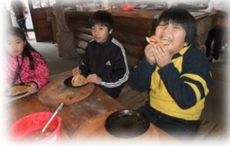
【窯焼きピザのおいしさに...】