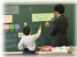
【算数「かけ算」の授業の様子】

日々、5名の児童としっかり向き合い、わかりやすい授業をめざして教材研究に努めています。2学期の算数「かけ算」の学習は3年生以降の学習にも大きく影響するため、かけ算を適用する場面を板書や教具の工夫により丁寧