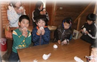
【塩むすびのおいしさを堪能】