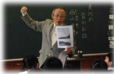
【熱弁を振るわれる先生】