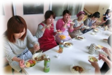
【お母さんたちもほっと一息】