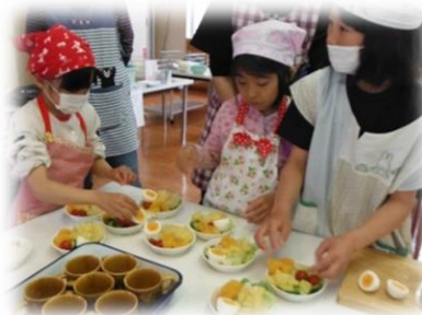
【サラダの盛りつけ OK!】