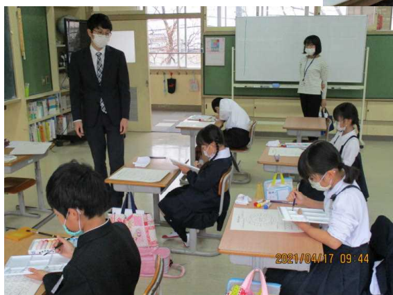
3・4年生 図工 「絵の具+水+ふで=いいかんじ」