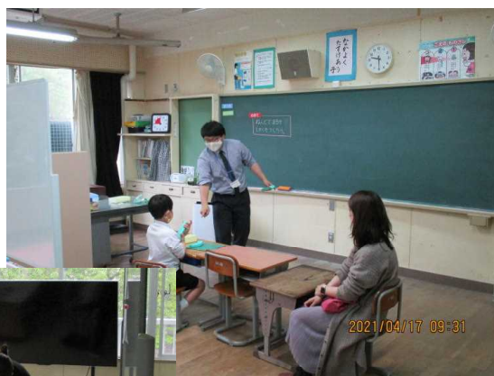
たんぽぽ 図工 「にぎにぎ ねん土」