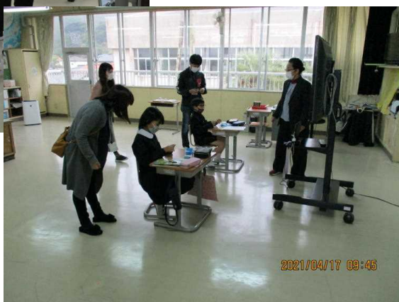
5年生 家庭科 「ソーイングはじめの一步」