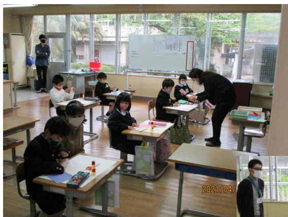
1・2年生 図工 「ちよきちよきかざり」

参観日は多数のご参観ありがとうございました。 初めての参観日で、担任も児童も少し緊張気味でした。