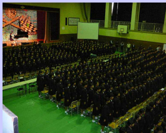
全校合唱〜僕が守る〜