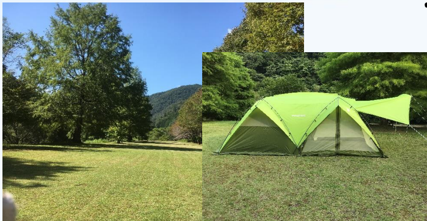
●快適テントはモンベルテント