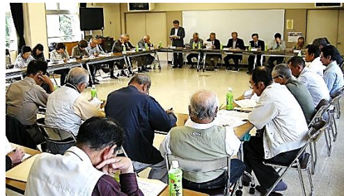
(平成 24 年 5 月の定例総会の様子)

各団体の代表、各地区の自治会長・社協委員等の出席の下に開催され、平成 25 年度事業・決算の総括および平成 26 年度の事業・予算等について討議が行われます。