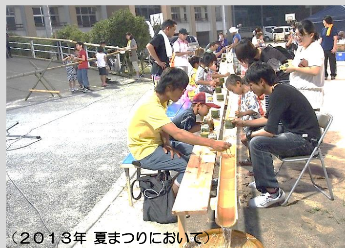
(2013年夏まつりにおいて)