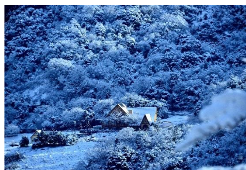
入賞 ファンタジックな鳴滝