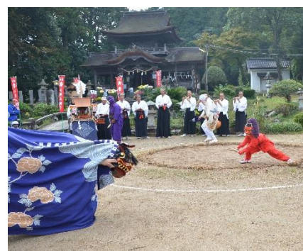
入賞 残したい郷土芸能