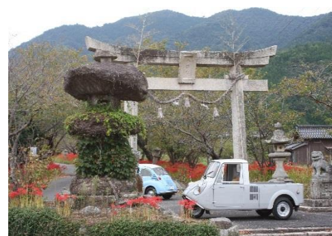
入賞 参道48年目の再会