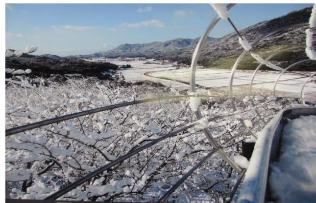
小鯖自治会長 賞 初雪染まる小鯖野