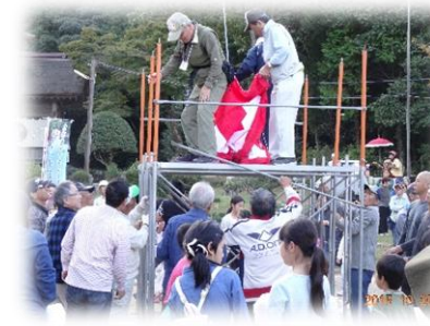
伝統の代神楽を觀賞したり、お神輿や餅まきにも参加しました。