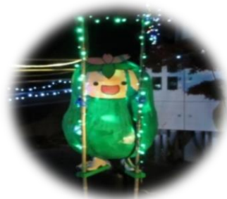
写真は昨年の様子