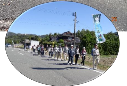
昼食後、希望者はオプションで江良堤までウォーキングしました。