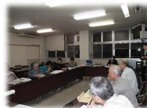
夢プラン策定委員会の様子