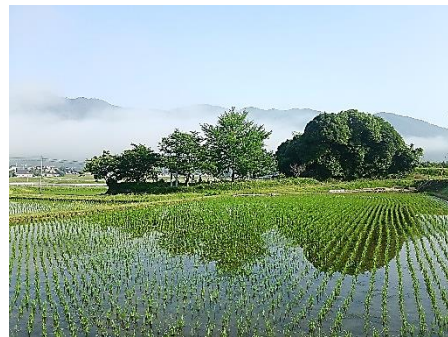
入賞 逆さになった鎮守の森