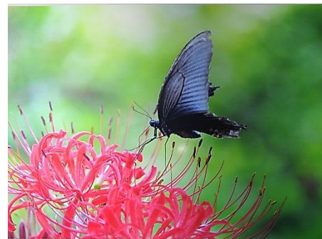
入賞 今年も咲いたよ