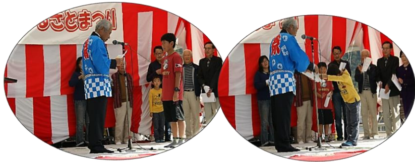
小鯖っ子の部(小中学生)