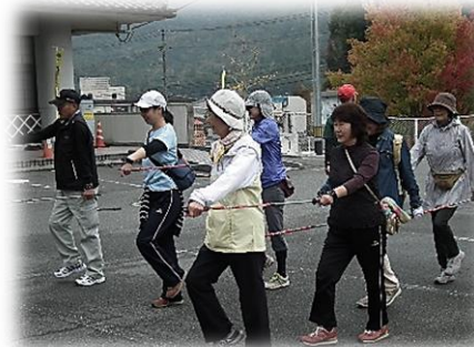
二人一組でのウォーミングアップ中です!!

足腰に負担がかからない上に、カロリー消費も40%UP、グリップを握っては離す動作から、脳も活性化されるそうです。