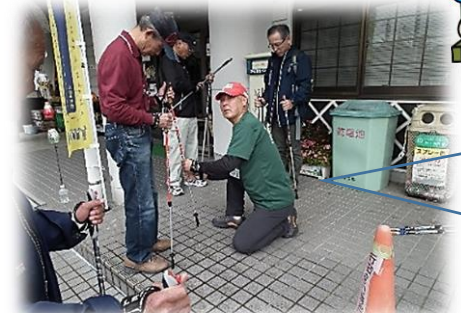
一人ひとり長さ調整してもらいました!