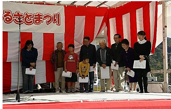
受賞された皆さま おめでとうございます