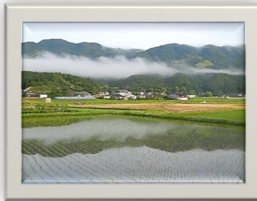
小鯖地域づくり協議会長賞 朝霧映えて

また、応募いただいた作品を地域交流センター・研修室前の通路に展示しておりますので、ぜひご覧ください。