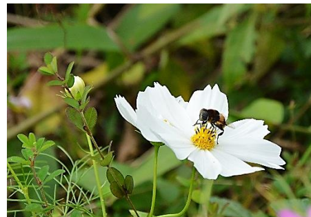
優秀賞 いただきます