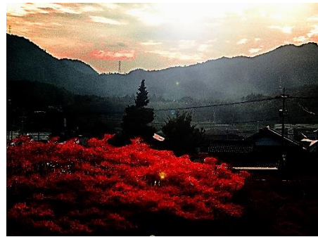
入賞 穏やかな黄昏