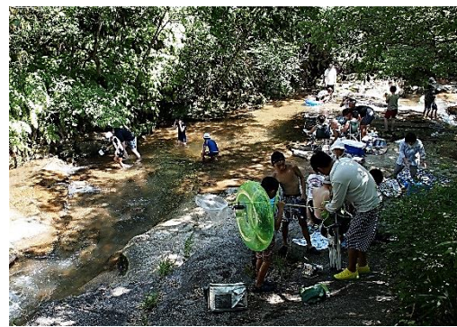
小鯖地域交流センター長賞 鳴滝清流でのひととき