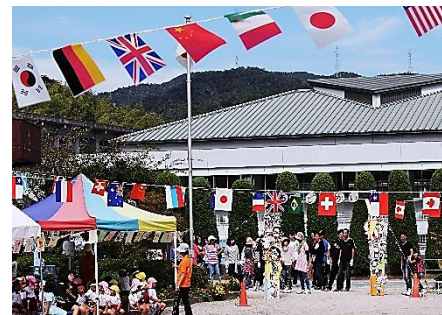
入賞 運動会