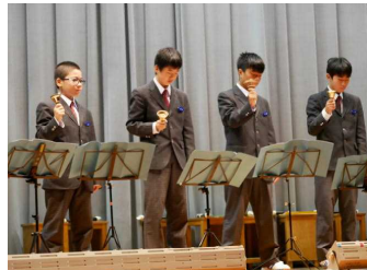
1年 詩の暗唱と演奏