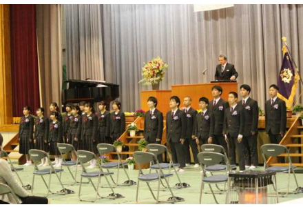
3年合唱「栄光の架橋」