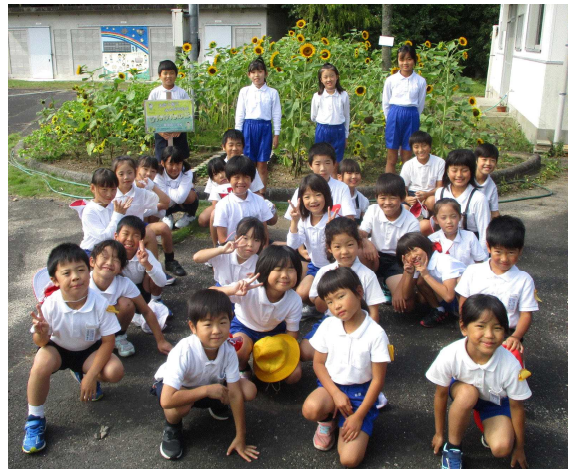
「人権の花」が見事に咲きました

一方、私たち大人は、子どもたちの心を癒やしたり、子どもたちに勇気が出たりするような言葉遣いや言葉掛けをしているのでしょうか。まずは、私たち大人がいさつや言葉遣いについて考えていく必要があります。「気持ちのよいあいさつをかわそう」「正しい言語活動の充実」は本校の子どもたちを育てるモデルです。大人が子どもたちの手本を示していきましょう。