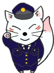
山口警察署マスコット コン太