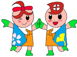
大田小マスケットキャラクター 「おーちゃん・だーくん」