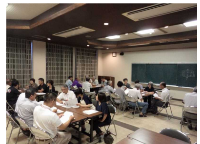
《こぶっちゃんゆかいな仲間たち》

教職員、保護者、地域、それぞれの部会から共通して出てきた意見としては、「子どもにスマホなどのメディア媒体を持たせないとうことは、無理。便利さとともに危険性を、小学校段階からしっかり教えていくことが大切ではないか。子ども以上に親世代の知識が遅れている。親子で共に学習する機会を増やす必要がある。スマホ中毒になっている大人も多にいる。まずは大人が使い方のよい手本となることが大切ではないか。そのためにも、美東地区で、大人も子どもも守るべきルールづくりができるとうよいのではないか。」などでした。本校でも保護者の皆様と共に、考えていきたいと思ひます。